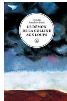
Dimitri Rouchon-Borie, Le démon de la colline aux loups (Le Tripode)