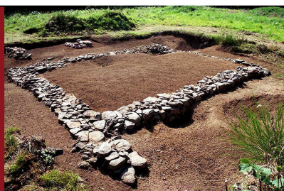
HALTE 3 - SITE GALLO ROMAIN DE BEAUCLAIR (Giat et Voingt)