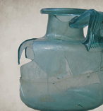
Urne funéraire en verre Pulvérières