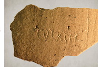
Graffito Totates Toutatis, dieu gaulois Voingt