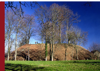
HALTE 5 - MOTTE CASTRALE (Giat)