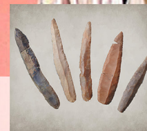
Poignards en silex Saint-Étienne-des-Champs